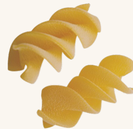
Il Ricciolone di Gragnano

La nostra gamma non è solo varietà, ma identità.