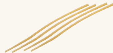
Lo Scialatello Lungo